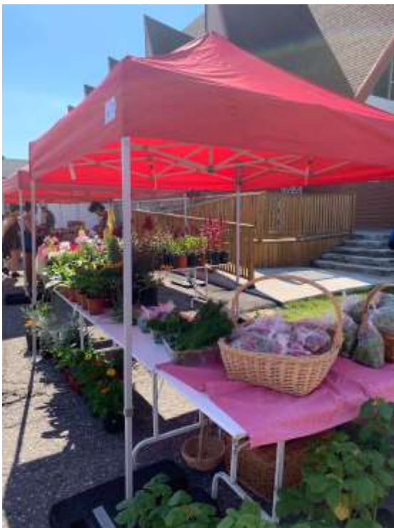
Kiosque des Amis de la Ferme Hovington