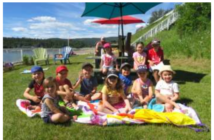
Les Tilous sont prêts pour une histoire !