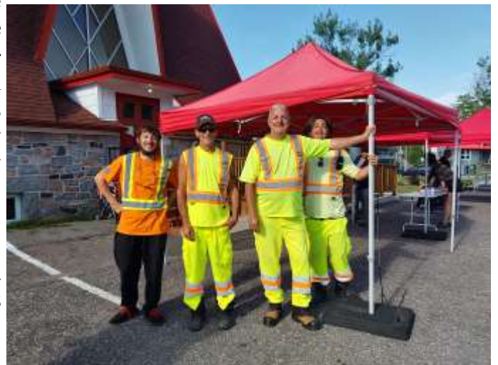
Merci à l'équipe de la voirie pour son aide dans l'installation du petit marché!