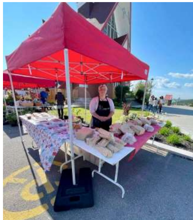
La boulangerie A L'Emportée