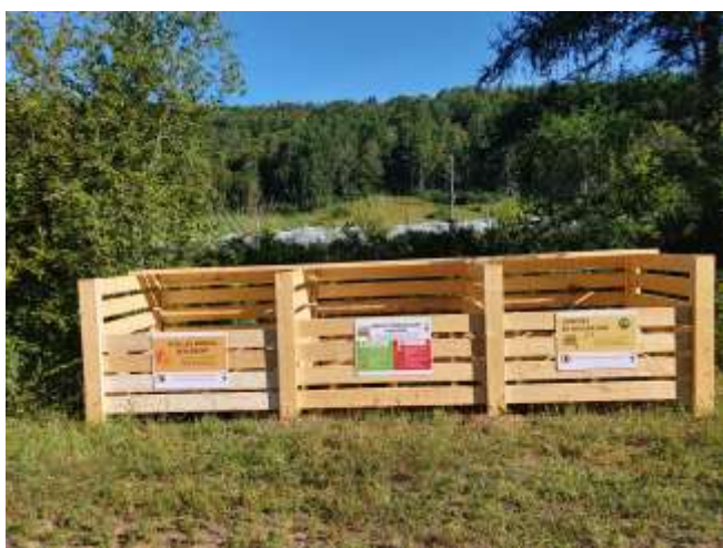
Vos matières organiques doivent être déposées AU MILIEU