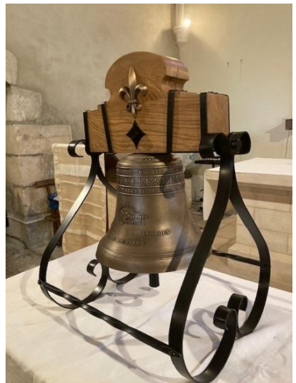
La Cloche « Louise »